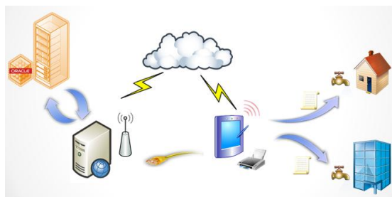
Gambar 1. Grandmap spot bill reading system .

Sistem tersebut berupa aplikasi berbasis website yang menyimpan data pelanggan, history pelanggan, pencatatan kubikasi meter, tagihan dan data keperluan operasional lainnya. Web Service digunakan untuk mengkaitkan berbagai aplikasi melalui Internet [7].